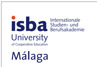
70% Skalierung des Logos für kleinere Formate, z. B. DIN lang hoch, Visitenkarten