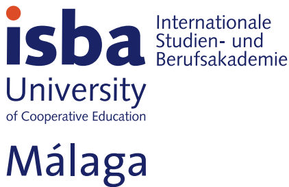
100% Größe des Logos auf DIN A4-Formate

sich proportional zur Größe des Mediums. Die Größenangaben sind auch für das Logo ohne den Zusatz „Málaga“ anwendbar.