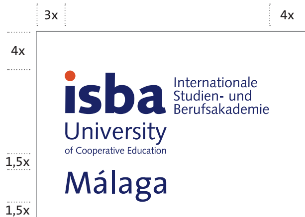
Schutzraum des Logos