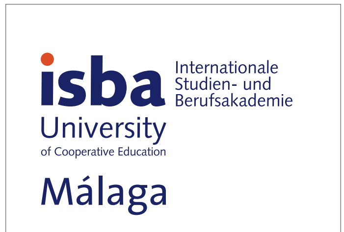
125% Skalierung des Logos für DIN A3-Formate