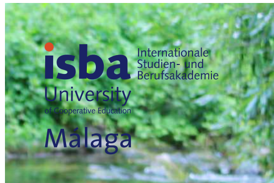
Logo auf einem Bild mit dunklem und unruhigem Hintergrund