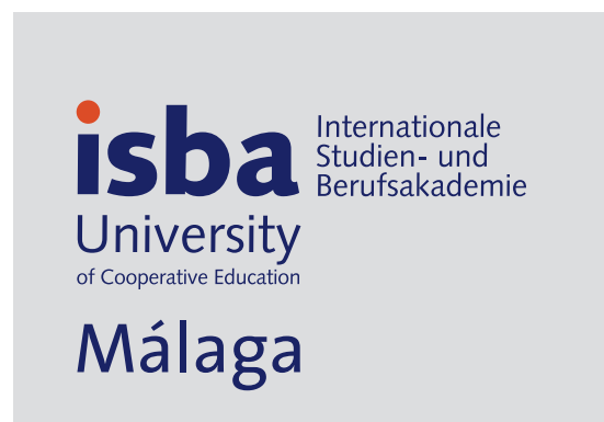
Das Logo auf 15k-Hintergrund